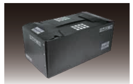
ダンブラケース (印刷あり)