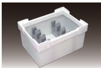
ダンブラケース + 架橋PE